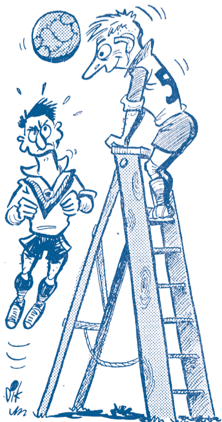
... een stevige trap kan heel nuttig zijn...