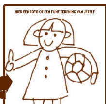
Het leukste zusje