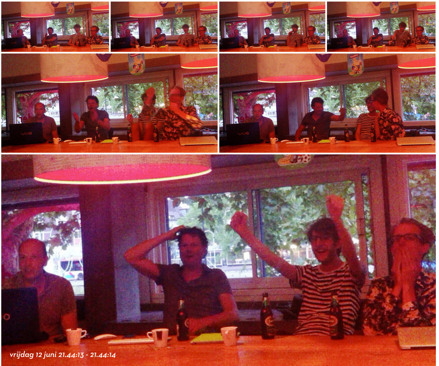
vrijdag 12 juni 21.44:13 - 21.44:14

Straal! Volgende week kan alles anders zijn! Zal alles anders zijn. En al die anderen, die zaterdag wakker werden met de mond nog steeds wijd opengesperd: we waren getuige van de wedstrijd der wedstrijden. Wat hebben we ontzettend gewonnen! Nuchter blijven? Beide benen op de grond? Echt niet! Hellden! Kampioenen! Piekuuuuh!!