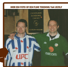
Foppe & Boppe

zorgen over het deelnemersaantal. Alfred: 'Rustig maar, de meesten melden zich pas op het laatste moment. En ja hoor. Alsof we opnieuw moesten beginnen!'