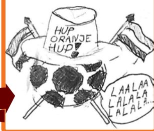
AARM (THE HALFTEEN BANANA)