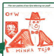
Ouder & Wijzer