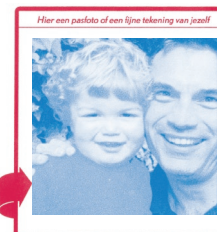
De Mannen Verdaasdonk