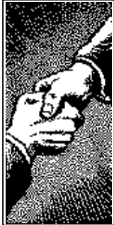
Al Gore: Here!

De score in de wedstrijd om de derde plaats leek heel even trendsoccer-achtige proporties aan te nemen. Bij wijze van hoogtepunt werd een eenvoudige kapbeweging van Larsson door een haast surrealistisch geraffineerde struikelacceleratie van een Bulgaarse verdediger gepromoveerd tot een wereld-actie. Boven het kapperijte glom Iwan v.h. van Gobbel heel eventjes van trots. Uiteindelijk werd de ruststand de eindstand, waardoor in de pool het aantal kanshebbers op de eerste plaats werd teruggebracht naar 4.