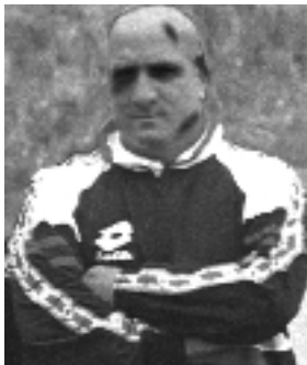
Dick Advocaat: "Van alles wat in de voorbereiding heeft plaatsgevonden, is slechts 15% naar buiten gekomen".