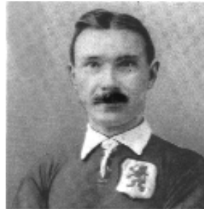
Mokken met Bok?