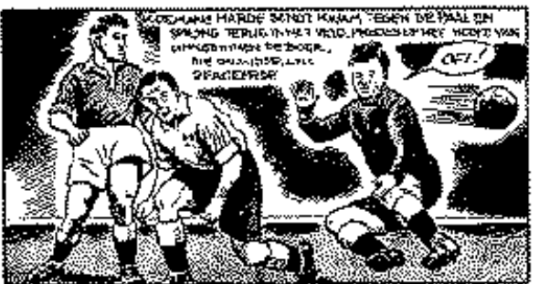
25 Juni Nederland-België