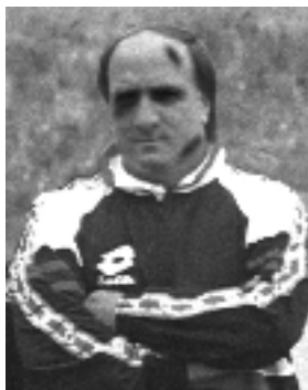
Dick Advocaat: "Van alles wat in de voorbereiding heeft plaatsgevonden, is slechts 5% naar buiten gekomen".